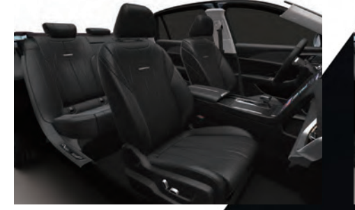
أسود | Graphite Black