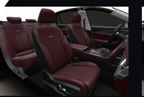
أحمر - أسود | Garnet Red - Graphite Black