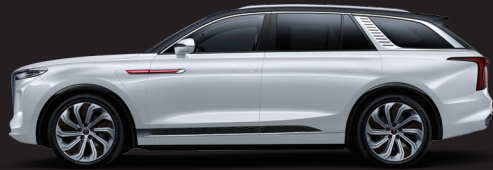
أبيض (سقف أسود) Elegant white (black top)