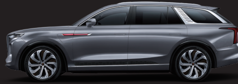
رمادي Quantum silver grey