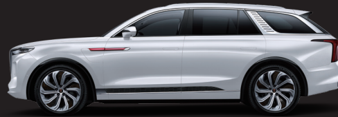
أبيض Elegant white