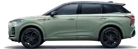
أخضر (سقف أسود) Yubai Green (black top)