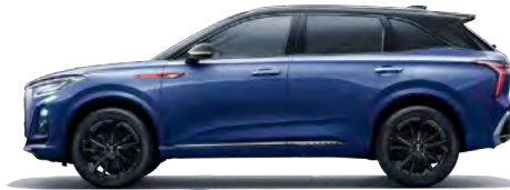
أزرق (سقف أسود) Bamboo Moon Blue (black top)