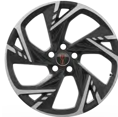
19-inch wheel R19 235/55 عجلة 19 بوصة R19 235/55