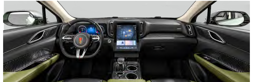
Graphite Black + Matcha Green