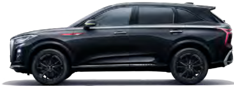
أسود Charming Night Black