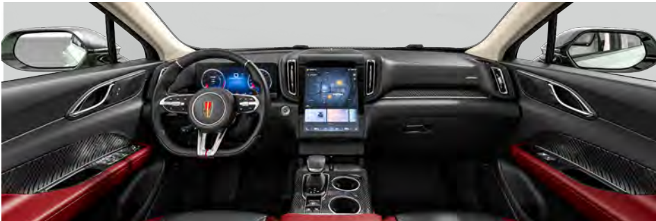
Graphite Black + Coral Red