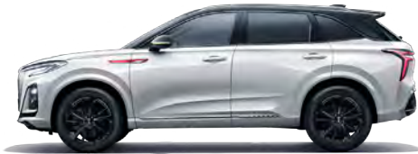
أبيض (سقف أسود) Alpine White (black top)