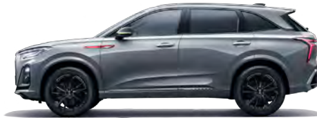
رمادي Art Grey