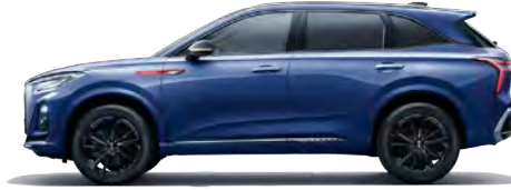
أزرق Bamboo Moon Blue