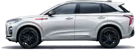
أبيض Alpine White