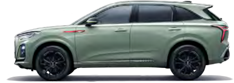
أخضر Yubai Green