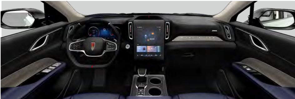
Charming Night Black + Glazed Blue