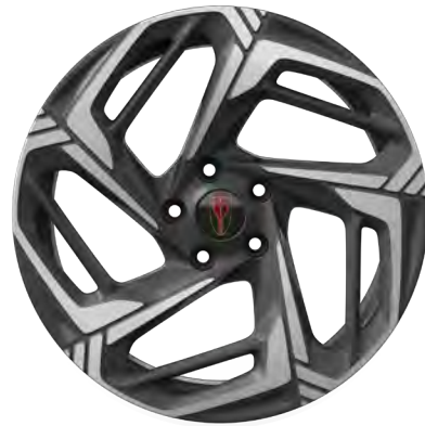
18-inch wheel R18 235/60 عجلة 18 بوصة R22 235/60