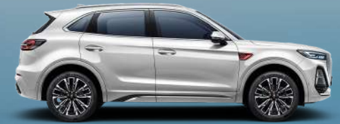
Alpine white | أبيض