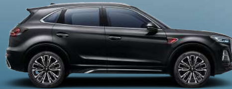
Charming Night Black | أسود