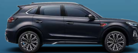
Brilliant Night Brown | بني