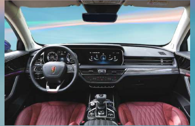
Red-Black Trim | أسود - أحمر