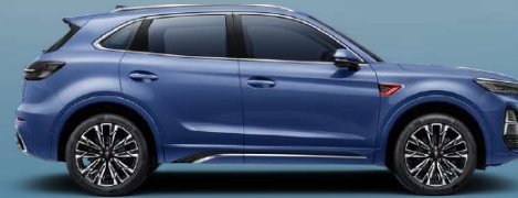
Valley blue | أزرق