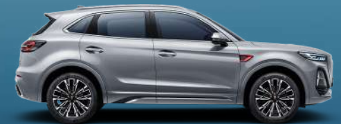
Art Gray | أبيض