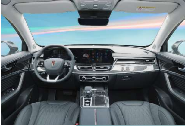
Black Trim | أسود