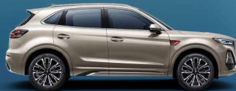
Platinum light gold | ذهبي بلاتيني