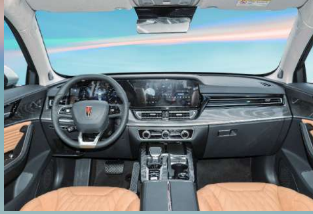
Brown-Black Trim | أزرق-أسود