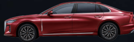
Rose Red | أحمر