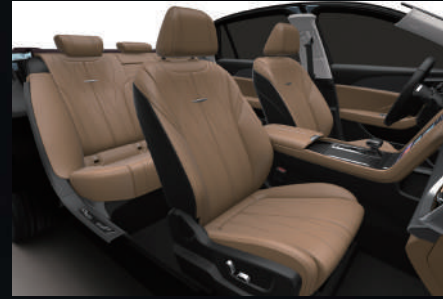
Soft Brown - Graphite Black | بني ناعم - أسود