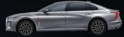
Quantum Silver Gray | رمادي