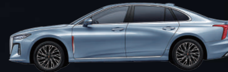
Aurora Blue | أزرق

The colors mentioned above are only indicative. Some of the colors and materials are subject to availability.