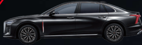
Charming Night Black | أسود