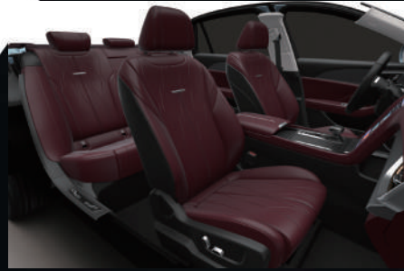
Garnet Red - Graphite Black | أحمر - أسود