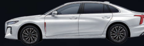
Ivory White | أبيض