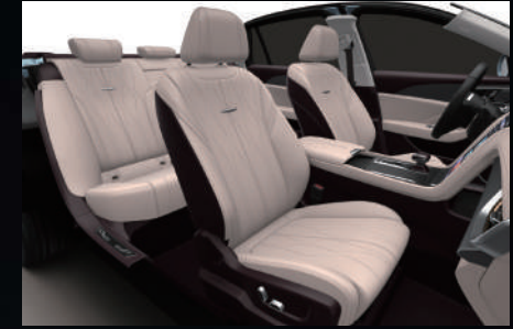
Ivory White - Rose Gray | أبيض عاجي - زهري غامق