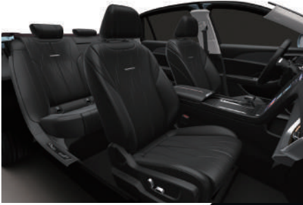
Graphite Black | أسود